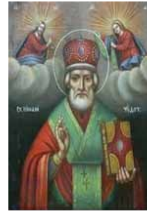
San Nicolas de Myra