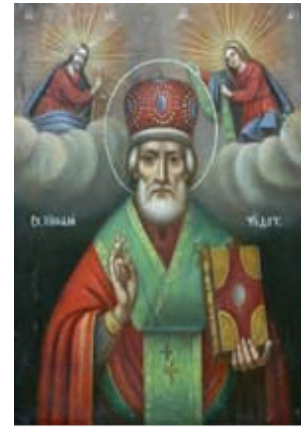
San Nicolas de Myra