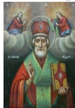
San Nicolas de Myra