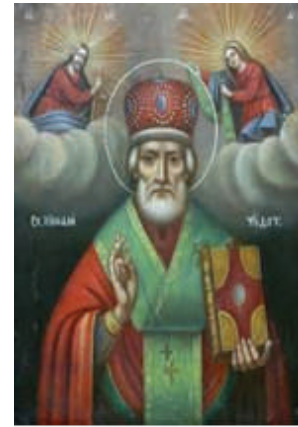
San Nicolas de Myra